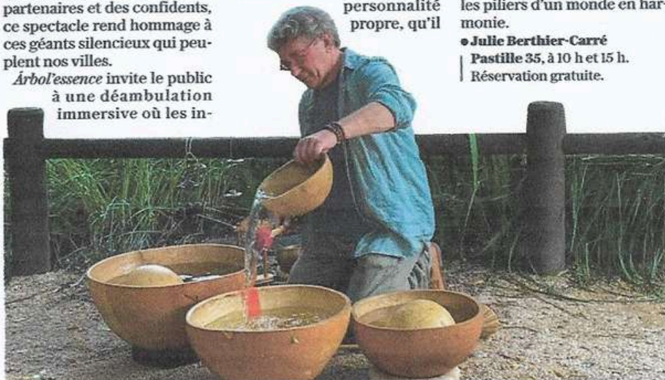
La compagnie Multitude soutient l'élan de végétalisation urbaine.